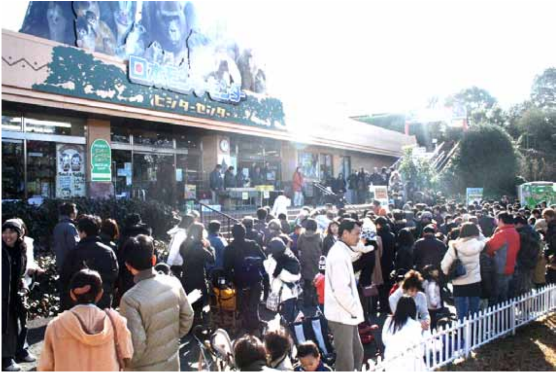
プレゼント会場に集まった来園者の皆様