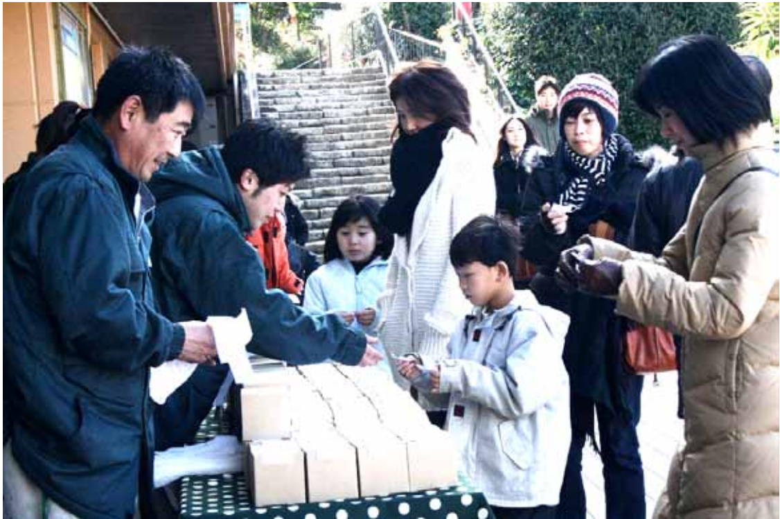
当選した方に奇跡のみかんをプレゼント