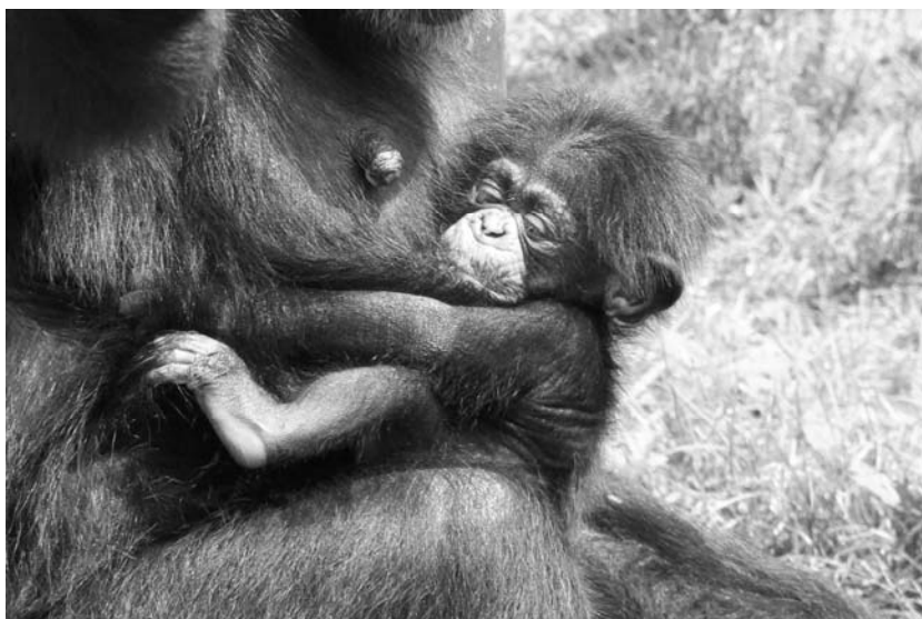
生後間もない頃の赤ちゃん