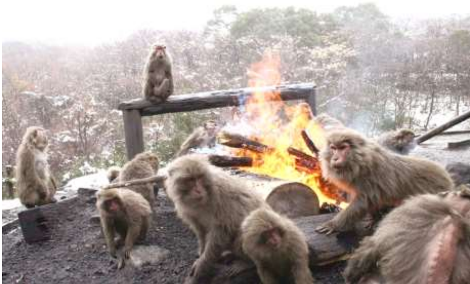
サルたちは本当にすぐ近くまで、炎に近づきます。