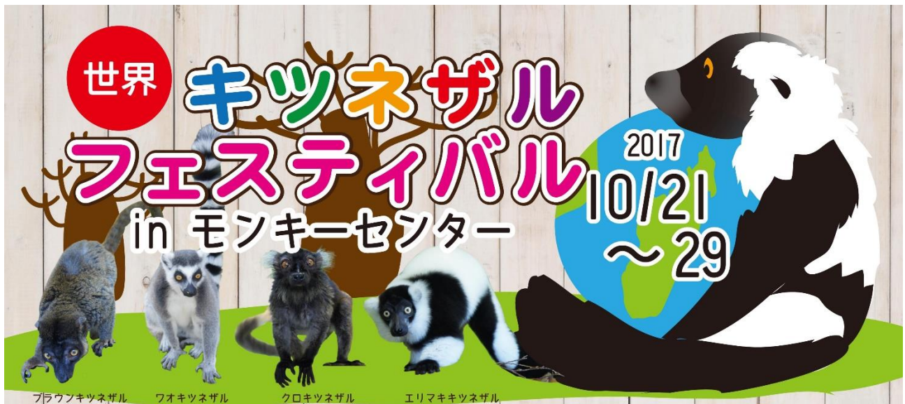
ブラウンキツネザル フォキツネザル クロキツネザル エリマキツネザル