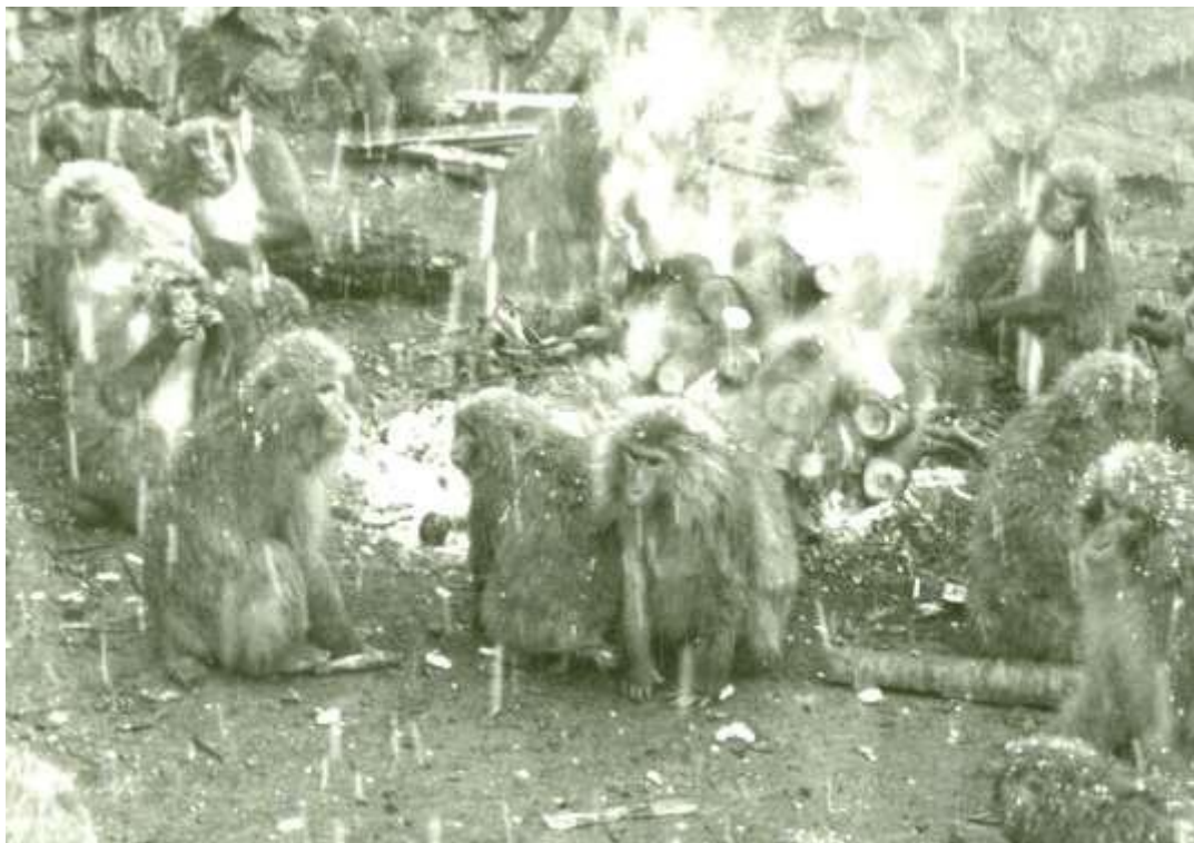
犬山野猿公苑で実施していた頃の「たき火にあたるサル」

日本モンキーセンターでは1957年（昭和32年）以来、8世代にわたってヤクシマザルを飼育してきました。かれらは研究者の研究対象として、また霊長類を学ぶための生きた教材として、多くの方に親しまれてきました。たき火にあたる行為は自然に発生したもので、他所ではニホンザルを用いて人為的に試みられていますが、8世代にわたって受け継がれ、0歳から母親とともにたき火にあたっているモンキーセンターのサルたちと同じようにはいかないようです。